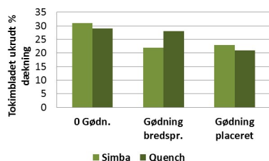
Figur 2. Procent ukrudtsdækning ved høst i Simba (svag konkurrent) og Quench (over middel konkurrent) i ugødet, bredspredt og placeret gødningsstildeling (gennemsnit af to forsøg). (Klik på figuren for stor udgave).